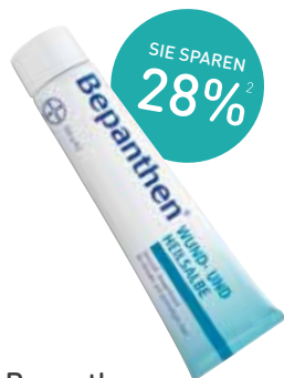
Bepanthen Wund- und Heilsalbe Salbe – 100 g