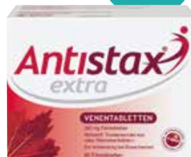
Antistax extra Venentabletten – 90 Stück