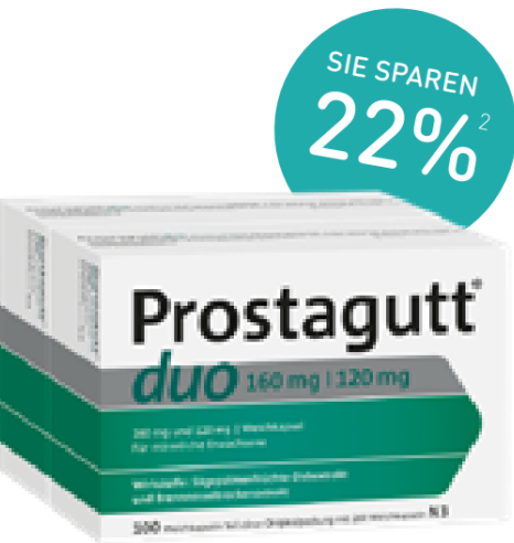
Prostagutt® duo Kapseln – 200 Stück