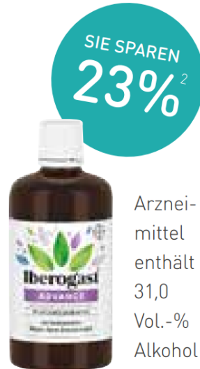
Iberogast Advance Fluid – 100 ml (29,98€/100ml)