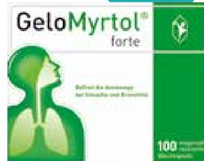
GeloMyrtol® forte Kapseln – 100 Stück